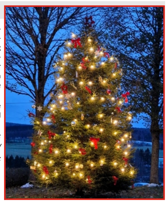
Anm. der Redaktion - Zitat eines Mitbürgers:

"Endlich mol willa ä rischtisch scheene Baam!"