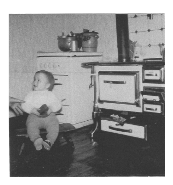
Kind vor Küchenherd - undatiert