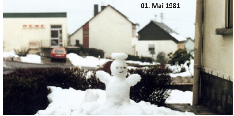
01. Mai 1981