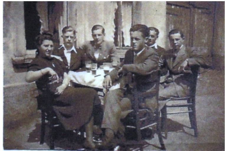
unten: „Wellems“, ausgangs 1930er

Text: Hans-Josef Koltes, Fotos privat / Archiv Koltes