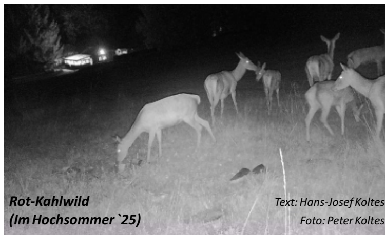
Rot-Kahlwild (Im Hochsommer `25)

Unsere Skipiste am Dollberg (einzige Wintersportanlage im Kreis Trier-Saarburg) steht nicht nur in Schneewochen (davon leider immer weniger) den Wintersportlern zur Verfügung, sondern, wie man sieht, ganzjährig auch unserem Wild als Äsungsfläche.