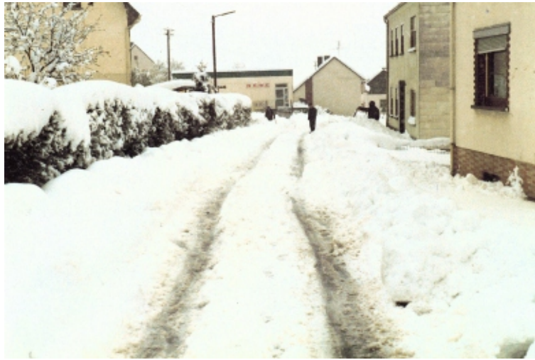
← Dollbergstr. 125

Schneechaos am Weißen Sonntag: Am Weißen Sonntag, 26. April 1981, brach ein Schneechaos über den Hochwald herein. Seit Jahrzehnten nicht mehr gekannte Schneemassen türmten sich über Häusern und Straßen. Geladene Angehörige von Kommunionkindern, auch außerhalb Neuhüttens, kamen von den Familienfeiern abends nicht mehr nachhause und mußten in den jeweiligen Dörfern und Haushalten übernachten.