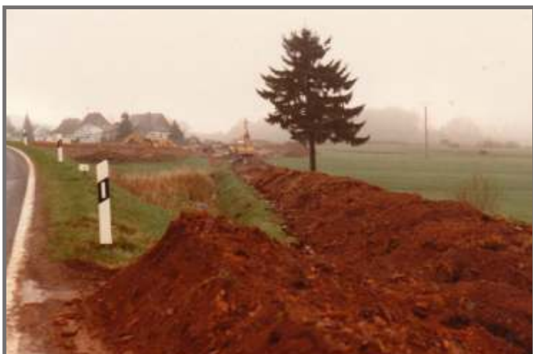
(Text und Fotos: Hans-Josef Koltes)

Frieden stellt sich heutzutage, allseits bang für uns in Frage, zwischen Menschen, die vertraut, auf die Zukunft einst gebaut, bei der Arbeit, gar im Sport, überall, an jedem Ort, hadern wir in einem fort.