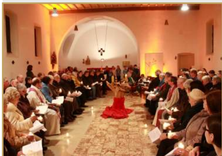
Ein Blick in den Innenraum der Kirche während der Eröffnungsfeier.

Am 02. Dezember 2016 fand die Eröffnungsfeier im Bürgerhaus Muhl unter reger Anteilnahme der Bevölkerung statt. Ein weiterer Schritt für die Steigerung der Attraktivität unserer Gemeinden. Lesen Sie einen detaillierten Bericht im Innenteil dieser Ausgabe.